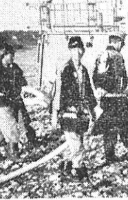
消防車仕様 ニッサン120馬力 森田式NF型高圧二段バルンスタービンポンプ 価格 2,850,500円

このほど、第一分団に新消防活動に威力を発揮する型のポンプ車が配備されることになりました。性能も一段とよく、