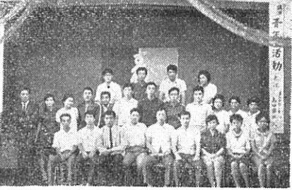
森吉町青年一夜研修会

事前の準備や、会員の連絡の面で、若干の不十分さはあったが、約三十名の青年達が、県社教高田氏や、町内の助言者を囲んで、じっくり話し合いました。この中で、原因の一つ一つがうきぼりにされました。