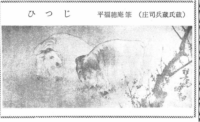
平福穂庵筆 (庄司兵蔵氏藏)

イ、公務、仕事などで他市町村に出張するとか仕事に従事中。口、やむを得ない用務事故で、他市町村に旅行または滞在中。ハ、病気等のため、歩行困難であること。 必要ない証明と手続き ①不在、出張、病気などを証明する書面。 ②証明する者は、官公署の長、社長等雇主、商店主、医師、助産婦等に備付けてあります。 ③証明書を添えて、本人が選管に投票用紙を請求する。 ④入院患者は、入院したまま不在者投票ができます(決められた病院に限る。)