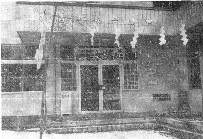
(竣工された総合庁舎玄関)