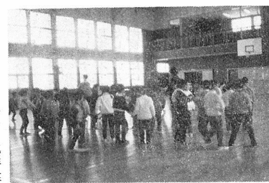
(新入学児童の一日入学)

まんまるい目をくりくりと一日入学をすごしました。さながら「ハイ」と元気よく手をあげる。先生のお話しにうなずいている、付いていけるおあさんが気にな