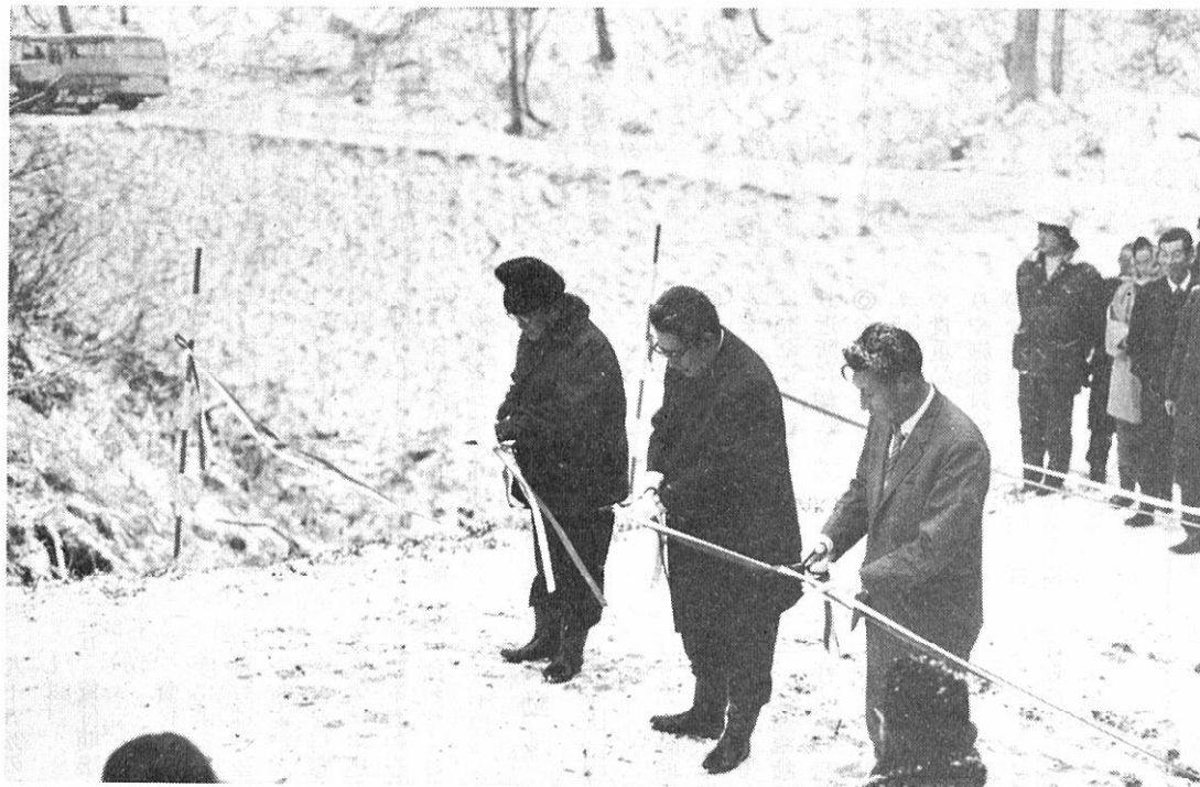
(テープカットする両町長と県林務部長)