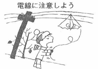
電線に注意しよう