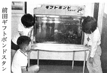
前田ギフトボンドスタン

近年、むし歯のり患者は増加の一途をたどり、しかも、年々低年齢化の傾向を示しています。 お子さんの口が常に清潔に保たれるよう、正しい歯口清掃の習慣をつけ、実践しましょう。