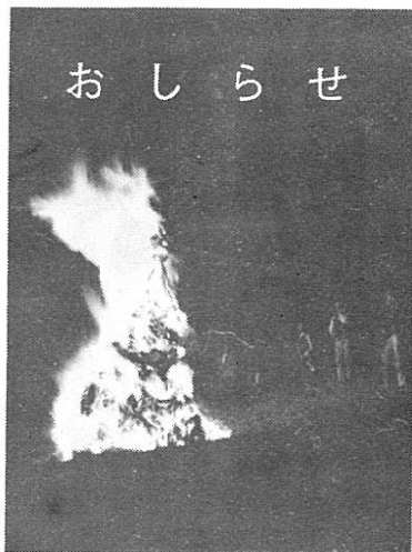
万灯火 (3月21日桐内沢で)