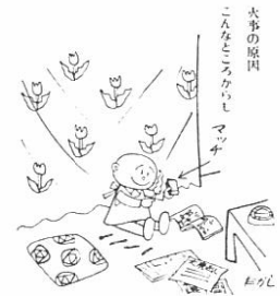
大がかりな油火災の 火事の原因 こまごまとくらし の火種

町内在住のご遺族の方々から貴重な戦没者の写真をお借りし、その写真とご遺族等について作成するものでありますのでご協力ください。(通知もれの方もあります) 老人福祉センター(電話〇一八六七 〇一三四九四)へお問い合わせください。 なお、発刊は七月中旬の予定であります。