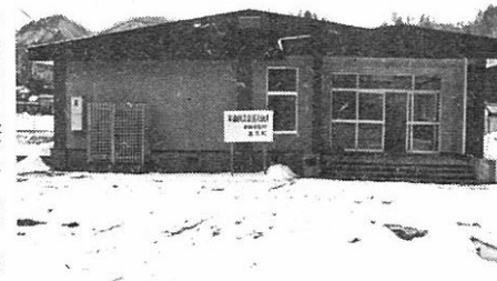
(新築された前田保育所)

追放しよう 酒飲み運転を 酒を飲んだ人には、絶対に酒を飲ませない。 酒を出した場合は、タクシーを利用させるように。 年始まりなど、酒が出される場所には、マイカーで行かないこと。 スリップ事故に注意を 雪道は、いつでも止まれる速度で走りましょう。 チェーンをつけても安全ではありません、運転は慎重に。