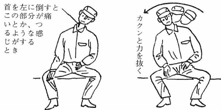
② 治し方の1例：右首スジに痛みがある場合

痛いところから、ゆっくり気持ちのよいほうへ動かす。いちばん気持ちのよいところで2~3秒間止め、その後ストンと脱力。3~4回くり返すと痛みやこりはとれてくる。首に少し力を入れながらゆっくり動かすとよい。