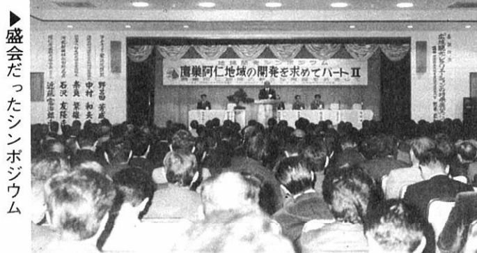
盛会だったシンポジウム

整備計画調査は、地域活性化の交通体系の整備、広大な土地を利用した経済基盤、広域観光レク施設、海洋と鉱山資源の有効活用など多角的な調査であることを説明されたあと本題に入った。