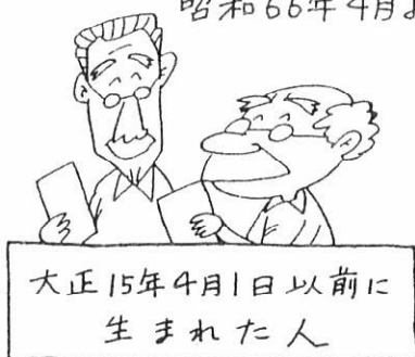
大正15年4月1日以前に生まれた人