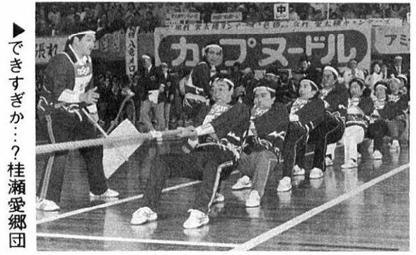
できすぎか...? 桂瀬愛郷団