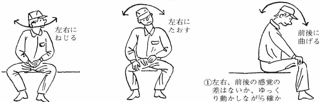
① 左右、前後の感覚の差はないか、ゆっくり動かしながら確かめる。