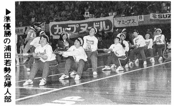
準優勝の浦田若勢会婦人部

第5回秋田県綱引選手権大会が1月26日、秋田市で開かれました。森吉町からは、男子が浦田若勢会(3回目) 桂瀬愛郷団(初出場) 女子は浦田若勢会婦人部(3回目) が出場しました。 結果は、52チームから勝ち残り、決勝に進んだ浦田若勢会婦人部が、決勝で川井体育協会に涙をのんだ。男子は12チームが参加、過去の実績をもつ浦田若勢会が実力を出し切らぬままに、また初出場の桂瀬愛郷団は「一回でも勝てば」から波にのり大奮闘、浦田とともにベスト16の成績を残した。