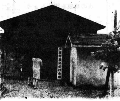
午前10時：町内会館にてられた生活学校会場に集つてくる。