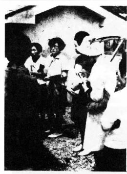
商店訪問について事前に打合せを行なう。衣料品と食品調査グループに分れて出発。

高めに、くらしの工夫運動を... 七月のはじめに行なわれた... 消費生活のあり方について... 生活学校は、商店をグループに分れて商品の性能、価格、量目などを調査した... グループでまとめた資料にもとづいて、正しい家庭経営に役立つようしている。