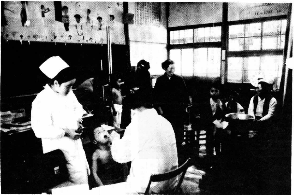
鷹巣小学校での就学児健康診断

●発行所 秋田県北秋田郡鷹巣町役場 ☎(01866) 2-1111 ●編集 総務課秘書係 ●発行部数 6,450部 ●毎月1日・15日発行 ●頒価10円 ●郵便番号018-33 ●印刷所 ㈱秋北新聞社