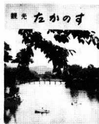
観光パンフレット

観光案内に一役をかうことになりました。パンフレットは、十七・五×二十一センチで横三つ折。カラー印刷。主要観光地、みやげ品、旅館案内、ハイヤー案内など掲載されています。