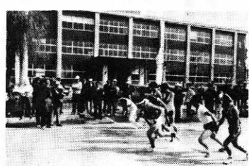
スタートする町民駅伝役場前

参加、十区間で熱戦が展開され、沢口チームが大会新記録で初優勝しました。 成績は次のとおりです。 ①沢口 二時間二十二分十七秒 ②坊沢 二時間二十四分十七秒 ③七座 二時間二十五分 ④綴子B ⑤綴子A ⑥栄 ⑦鷹巣 ⑧七日市 ⑨村上土建