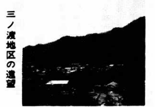
三ノ渡地区の遺蹟

昭和四年秋田師範学校卒業と同時に教職員を拝命、昭和二十五年赤川小学校長を振出した大館北秋の主な小、中学校長を歴任し、この間に鹿角教育事務所指導主事、北教育事務所副所長、教育庁保健体育課長補佐の要職歴任。四十三年三月鷹巣中学校長を最後に退職。前森吉町教育長、現在鷹巣町陸協会長、鷹巣町体育協会長