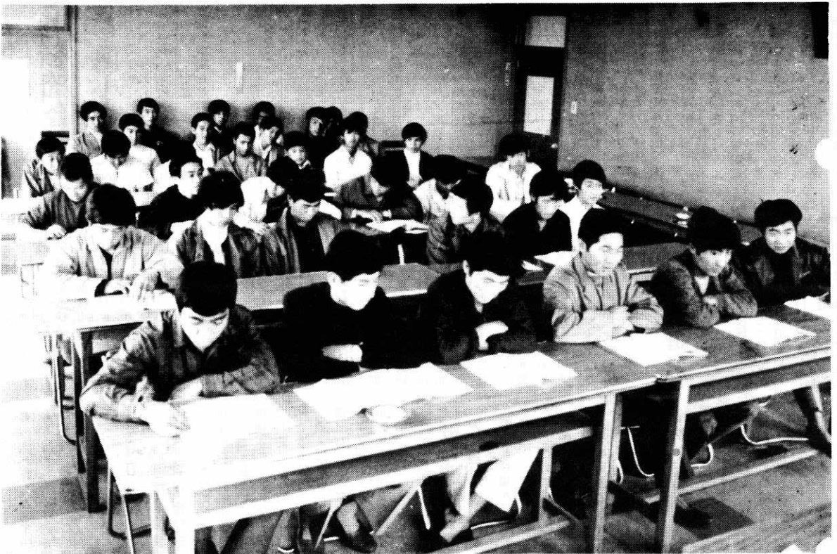
職業と勉学を両立させる仲間たち —入校式で—

◆発行所 秋田県北秋田郡鷹巣町役場 ☎(01866) 2-1111 ◆編集 総務課秘書係 ◆発行部数 6,450部 ◆毎月1日・15日発行 ◆頒価10円◆郵便番号018-33 ◆印刷所 秋北新聞社