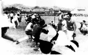
8月23日—第8回町民体育祭が行なわれる