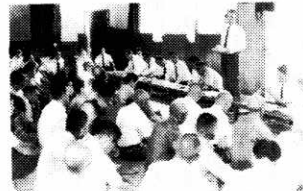
8月27日—移動県庁が親子公民館で開かれる