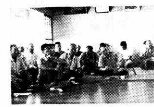
9月4日—大野尻で移動町民室開かれる