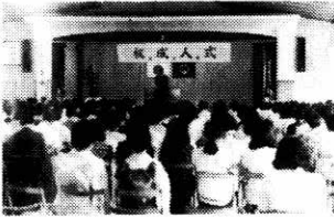
8月15日—成人式が公民館で行なわれる