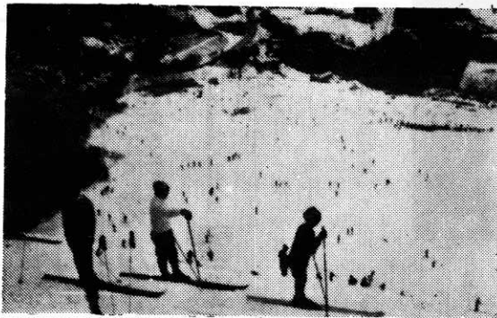
— 広大な町営薬師山スキー場 —