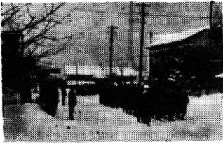
— 分列行進 —