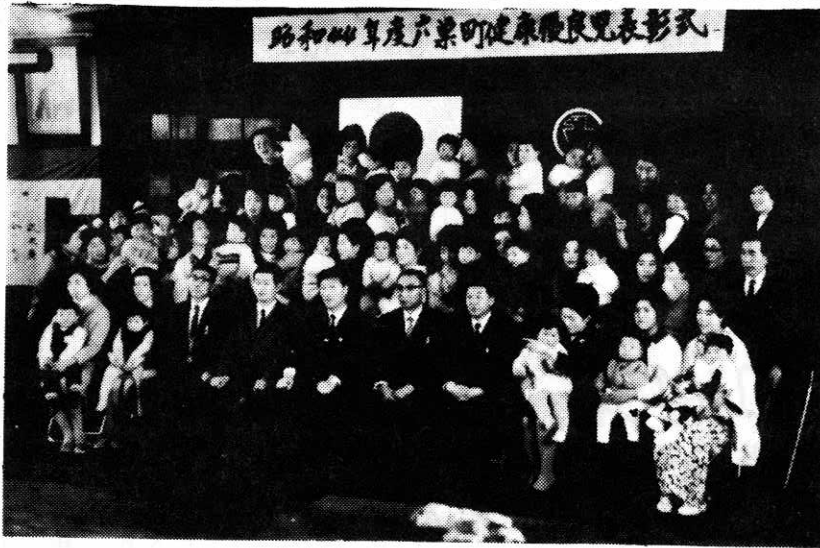
— じょうぶな赤ちゃんが勢ぞろい —