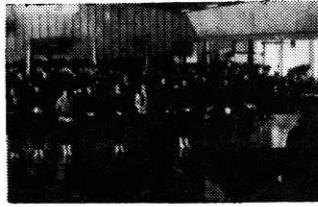
— 表彰式 —