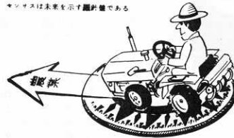
センサスは農業を示す図記号である

その調査結果を農業集落、市区町村といった小地域の範囲で集計し、統計資料を整備することによって、これら地域における農林業の現況を明らかにすることが出来ます。したがって、このセンサスの結果は、国、