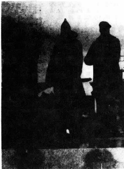
▶革命を記念して建設した銅像がいたるところにみられました。

私が、これがソビエトという国だなあと考えた事は、ロシア人のんびりとした気質のため、ハバロフスクで飛行機を十一時間待たせられた事です。その間、ロシア人の乗る飛行場に行つて聞いて見ます