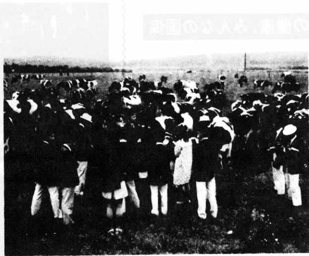
▲イルクーツクの研究農を視察する訪ソ団員