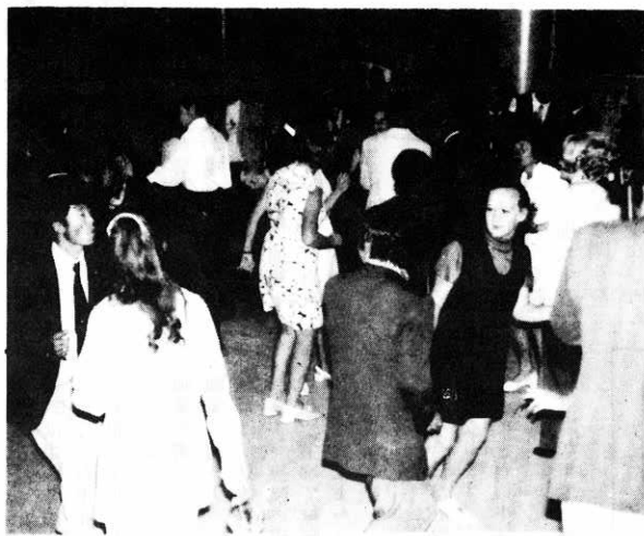
▲ソ連青年との交歓風景

そして私自身もソ連を見学し、ソ連の人々と交流を通じて、我郷土秋田を顧み、再認識する大きな研修の意義があったと考えている。ソ連には「日ソ友好協会」があり青年達も日ソ友好発展のため努力をしています。そして私達を暖かく迎えてくれたことを忘れません。私は日本人として秋田県人としての誇りをなお一層強く胸に刻むことができた。そして郷土秋田を愛する青年の一人として、地域で青年会で努力を惜しまず頑張りたいと思います。