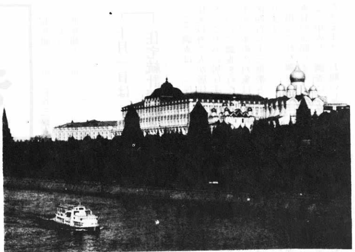
▲クレムリンとモスクワ川

と、飛行機に乗るため、四日も待つている人もいと聞いて、せわしいこの日本ではとても考えられない事ではないと思つた訳です。日本では経験できない良い経験だったと思います。それから、ナホトカからハバロフスクへ向う列車から見た風景で、馬車で草を運んでいるのを見て、卒直に言つて、日本より遅れているのではないかと思つきました。コルホーズ・ソホーズを、実際に来た訳ではありません