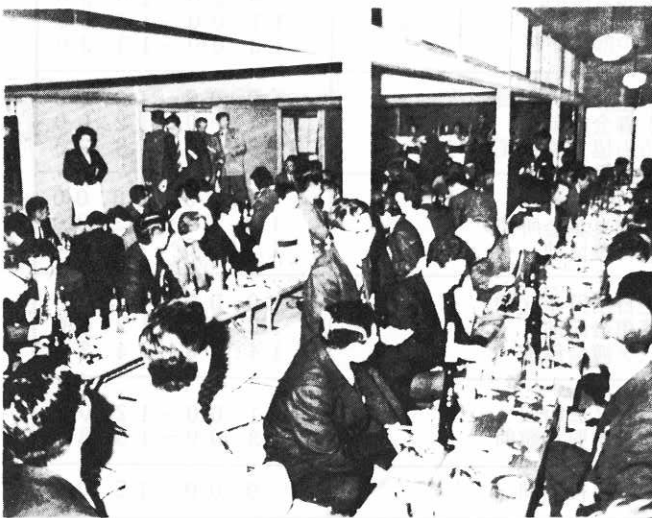
▲ 雨のため青葉荘で行なわれた園遊会

内訳は、速度違反七十七件、よっぱらい運転二件、無免許運転二件など、まだまだ運転者の無自覚が目立ちます。 捜査関係では、空車事件が一件発生、暴力事犯はゼロでした。 全般に昨年より件数が減っていますが、これからは山菜とりや竹の子とりと、ますます野外へ出かける機会が多くなります。疲れていても無理な運転をしたり、外出の際の戸じまりなど十分注意してください。