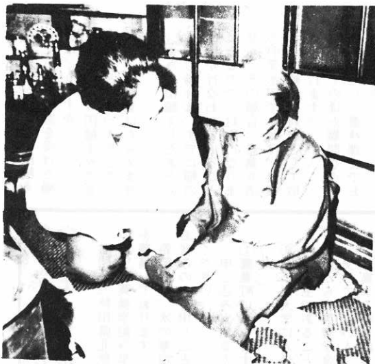
ツメをきりながら世間話し