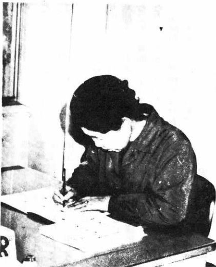
訪問日程や報告など事務整理する