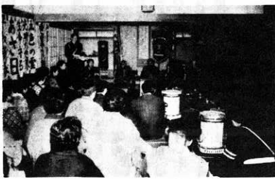
部落民と警察の座談会