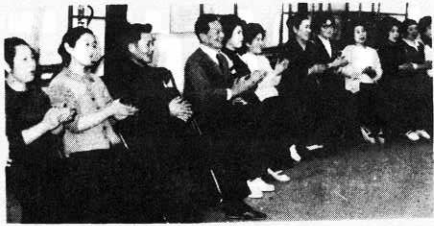
県青年の家での研修会

イ、履歴書には最近撮影した上半身、正面向、縦四、横三の写真をはって下さい。ロ、この試験についての問い合わせは、役場町民課福祉係でお答えします。