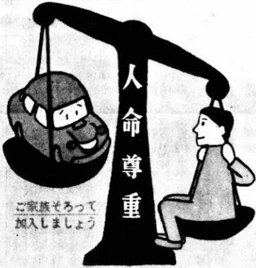
秋田県市町村交通災害共済組合 鷹巣町

交通災害共済 受付 2月1日 掛金1人年額300円共済金死亡50万円障害5千円 20万円