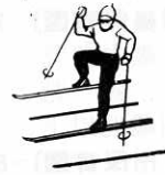
冬に鍛える生活を 規律ある生活を