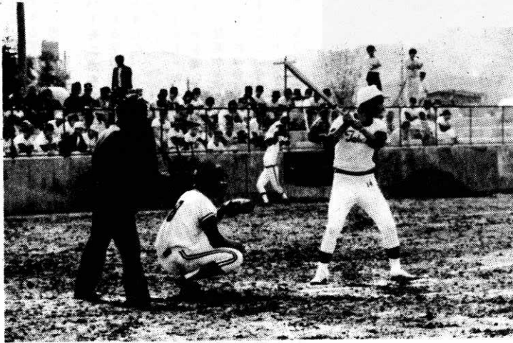
▲中央公園下にオープンした町民球場

中央公園下に建設していた町民球場が、一部内野スタンドをのこして……完成、六月二十八日の職場対抗野球二十周年記念大会を皮切りに、野球……が行なわれています。