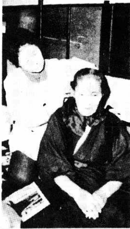
▲老人福祉対策の一環として活動する老人家庭奉仕員

昭和四十九年度社会福祉法人鷹巣町社会福祉協議会の収支の計算は次のとおりです。報告いたします。 収入総額は九百三十三万二千九百四十九円、支出総額は六百九十八万六千二百三十三円で差引き二百三十一万六千八百二十六円の剰余金が、昭和五十年へ繰越しました。 (収入の内訳) ▽会費 六万四千円 ▽普通会員一人五百円の九十三名分 ▽賛助会員一人二千円の八名分 ▽委託料 二百四十九千円 ▽福祉活動専門員と家庭奉仕員の委託料として国・県・町がおのおのの三分の一を負担。 ▽共同募金配分金 百九十五万三千八百六十二円 ▽補助金 二百一十一万三千七百円 ▽町補助 二百万円 ▽県社協補助 十一万三千七百円 ▽寄付金 百六十七万四千円