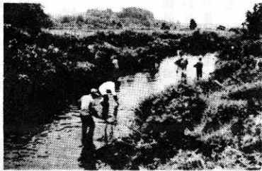
▶摩当川のクリーンアップ

「ふるさとの川に清流をとりもどそう」と、綴子川に続く河川のクリーンアップ作戦が、六月八日午前五時から七時までの二時間にわたり、摩当川