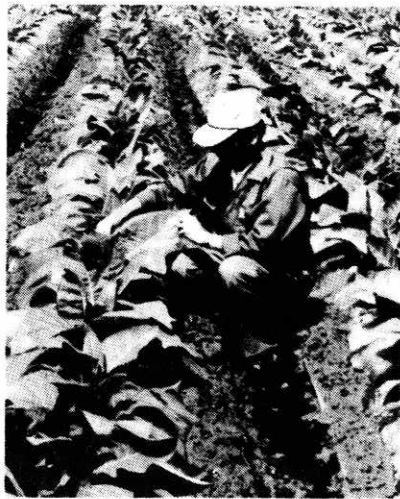
▲順調に生育している葉たばこ(脇神)