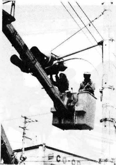
▶交通信号灯を清掃する東北電力の社員

東北電力では、毎年春秋の二回「サービス旬間」を実施、地域への奉仕活動を続けておられますが、このほど行なわれた春の旬間に、本町へ防犯灯六灯が贈られました。昭和四十二年から毎年続けられており、昨年までに五十五灯が贈られています。 贈られた六灯については、町長と語る会などで要望が感謝されています。 こうした同電力の地域への奉仕活動は関係者から深く感謝されています。