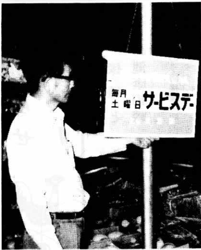
▲毎月第3土曜日が生鮮食品奉仕販売デー

協力店の店舗には、写真のような協力店の標識が掲げられておりますので、ご利用ください。 六月の生鮮食品奉仕販売日は二十一日です。 なお、町内の生鮮食品販売店は次のとおりです。 ▽坊沢地区 浅村商店、桜