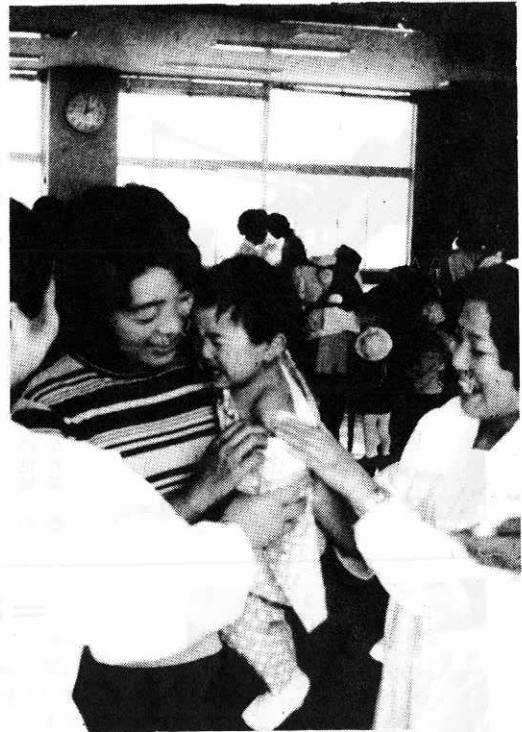
▲各種予防接種、検診はすすんで受けよう!!