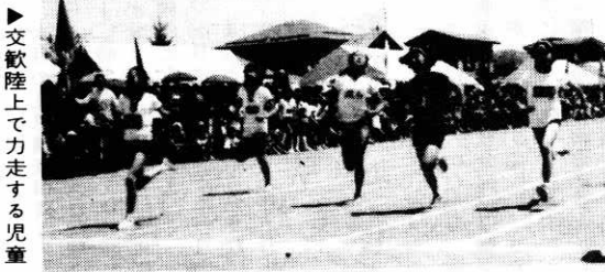
▶交歓陸上で力する児童

(夏休み期間除く) 時間 午後4時~5時30分 会場 鷹巣体育館 種目 卓球 毎週木曜日 バスケットボール (ミニバスケット含む) ※毎週金曜日 ジュニアトレーニング (器械運動含む) ※毎週木曜日 なお、申し込みは鷹巣体育館(電話二一三八〇〇)へ6月10日まで。参加料は二百円です。(開講式当日でもよい)