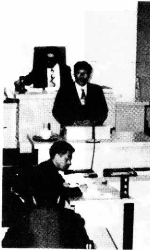
▲議会であいさつする出川町長