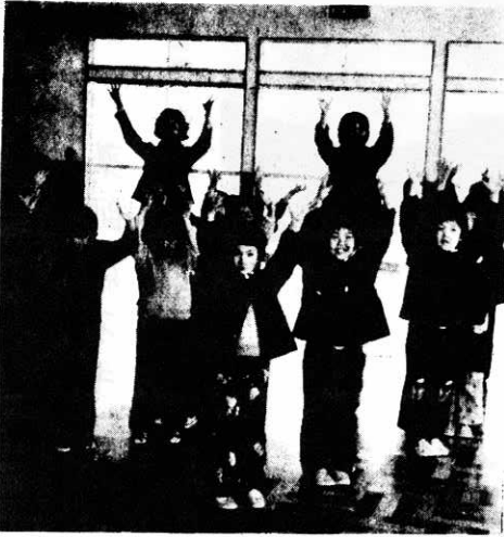
▲広い遊戯室で、元気に遊ぶ園児たち

▼…… 昨年の九月から東小学校わきの敷地を造成、着工していた東保育園が…… ▼…… 完成、一月七日から、全館暖房のあたたかい部屋で、園児たちは元気に…… ▼…… 遊んでいます。