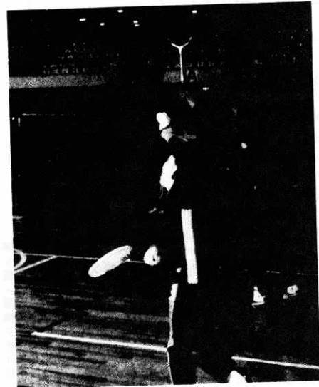
◀ 見るとゲームでは大違い!! バドミントン教室

どうしても運動不足になりがちな冬期間を、思いっきり動きまわってもらおうと、体育館ではスポーツ教室を開いています。 スポーツ教室は、壮年、主婦、青年、テニスなど八教室ですが、どの教室も好評で多くの人が参加、汗を流しています。 体育館では、二月いっぱいスポーツ教室を開いていますので、「あなたも参加を」と呼びかけています。