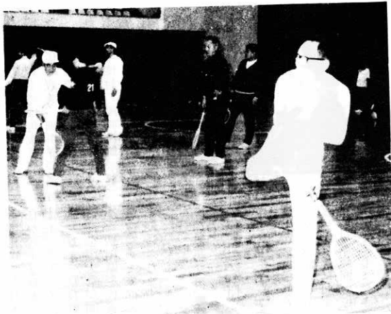
▲ かけ声をかけて球を追う＝テニス教室