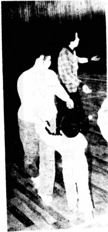
◀ 子ども連れの主婦も参加イチ、ニツ、イチ、ニツ 親子の会話に、教室もなごやかにあります。

どうしても運動不足になりがちな冬期間を、思いっきり動きまわってもらおうと、体育館ではスポーツ教室を開いています。 スポーツ教室は、壮年、主婦、青年、テニスなど八教室ですが、どの教室も好評で多くの人が参加、汗を流しています。 体育館では、二月いっぱいスポーツ教室を開いていますので、「あなたも参加を」と呼びかけています。