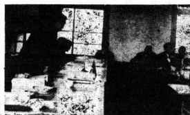
【議会で町の町長の予算説明】

三十五年度の予算で自立した点は、歳入で町税の固定資産税〇.二%引上げたこと、歳出で新町建設費計画事業の二年目のものを全部計上している。