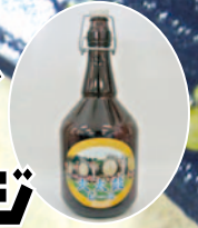
特別販売される 大太鼓ビール