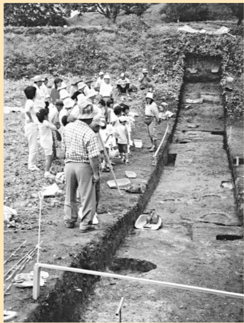
安東氏の居城檜山城址を見学 ～夏休み歴史チャレンジ隊

秋田の歴史の一端を勉強しようということで安東氏の居城であった能代市の檜山城址と男鹿の脇本城址、さらに水族館「GAO」を研修地として小学生22人を含めた総勢57人が出発しました。脇本城址では、往時の安東氏の手を十分に理解し得るだけの広さと発掘物の多さに感心しました。城址見学の感動の余韻を残しつつ、水族館に到着。早速、待望の白熊にご対面しましたが、動きがなく少々がっかり。その後何回も白熊を見ることが出来たのでみんな満足して帰路に着きました。