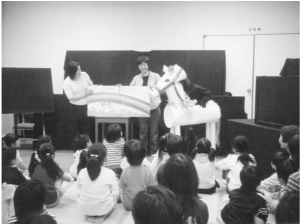
「おはなしでてこい」は毎月第3土曜日に開催

図書館ボランティア「たまたまばこ」による『おはなしでてこい』が、8月20日北秋田市文化会館でおこなわれ、たくさんの親子がおはなし会を楽しみました。