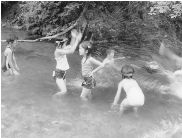
川の中でおおはしゃぎ～わんぱくクラブ