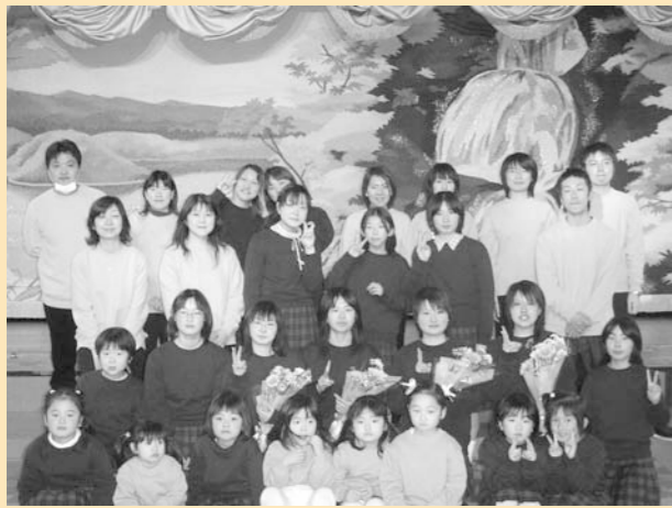
世代を超えて活動を行う合唱団のみなさん

また、卒団生による「MMC」、保育園児たちの「はまへのうたキッズ」とともに、年齢を越えて地域でつながって活動しています。