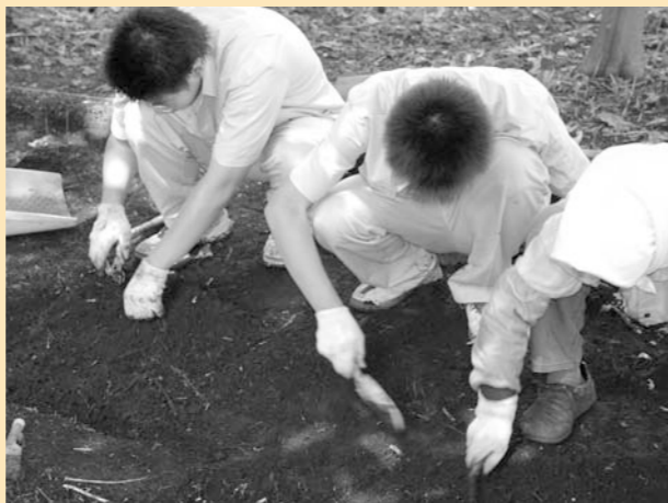
ていねいに根気よく作業をすすめる鷹農生

各高校では社会人としての基礎的な心構えを養うために就業体験学習が行なわれています。伊勢堂岱遺跡では8月29日から3日間にわたり鷹巣農林高校2年生(2人)が就労を体験し、発掘作業を行いました。