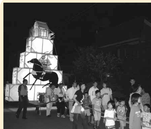
高さ4mの絵灯籠が街を巡行

祭り本番は、太鼓と笛のはやしがり鳴り響き、大絵灯籠が巡行し、沿道の見物人も大勢で賑わいをみせ、行く夏を惜しむかのように伝統の行事を見送りました。