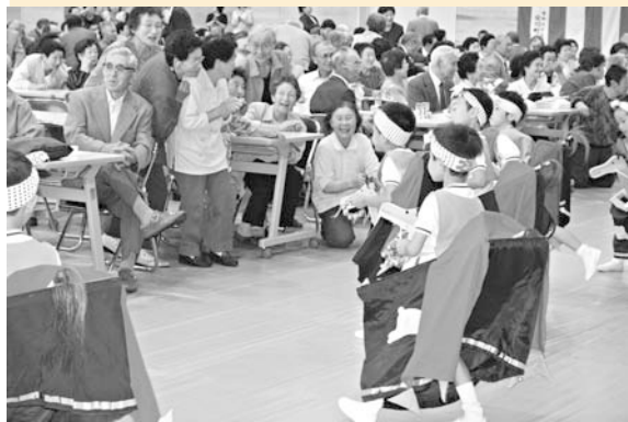
あいかわ保育園児が駒踊りを披露し、会場は、笑顔でいっぱい

合川会場は、合川体育館で開催され、約500人が出席。市からのお祝品として、75歳以上の方には「敬老湯つこめぐり利用券」、米寿（88歳）の方には「長寿杖」、白寿（99歳）の方には「長寿布」が贈られました。また、同時に行われた金婚（結婚50周年）、ダイヤモンド婚（結婚60周年）のお祝いでは、記念額付きの「お祝い状」が贈られました。式典後には、あいかわ保育園の園児、合川民謡同好会の演芸が披露され、会場はおおいに盛り上がりました。