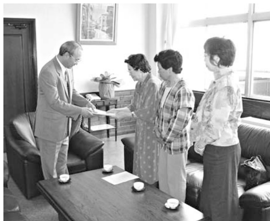
「郷土芸能の普及などに役立ててください」

この本についてのインタビューが9月28日早朝4時から45分間、NHKの「ラジオ深夜便」で全国放送される予定です。