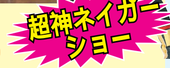
超神ネイガーショー