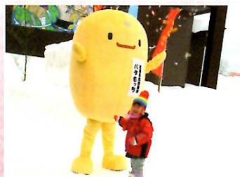
平成25年2月 もちっこ市に「パタもち」登場