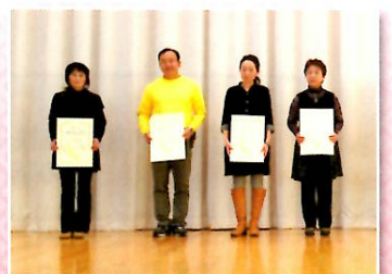
平成26年10月「BMセレクション2014プロコンテスト」のBIG4