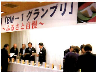
平成26年4月 バター餅の品評会「BM-1グランプリ」最終審査