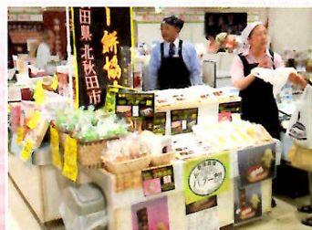
平成25年7月 阪急百貨店うめだ本店(大阪市)における「北あきたバター餅」販売