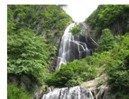
安の滝 (中ノ又溪谷)